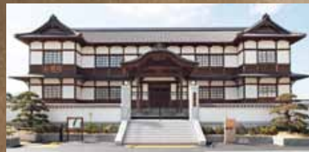
旧和歌山県議会議事堂