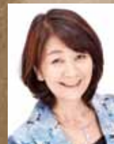
須磨 佳津江 フリーアナウンサー