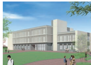
看護学部棟 3階建ての学舎に充実した学修環境を整備。

最先端の学修環境で高度な知識と技術を身につけ、地域を支えるケアのプロフェッションをめざす!