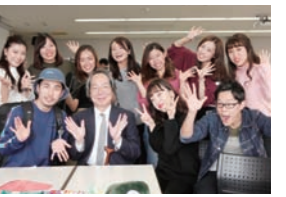
▲昨年の「保育科在学生・卒業生交流サロン」

「保育科在学生・卒業生交流サロン」を開催します。学生時代の思い出に花を咲かせたり、保育現場や子育てに関する情報を交換したり、在学生の疑問質問に答えていただけるスペースを準備して、お待ちしております。保育科同窓生の皆様でお誘い合わせの上、是非お立ち寄りください。懐かしい卒業生の皆様とお会いできるこの機会を、私たち教員も心から楽しみにしています。