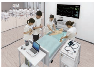
シミュレーションセンター 高機能の患者型シミュレータを導入。すべての領域であらゆる事例に対応できる、実践力の高い看護師を育成します。