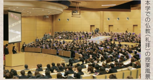
本学での仏教(礼拝)の授業風景