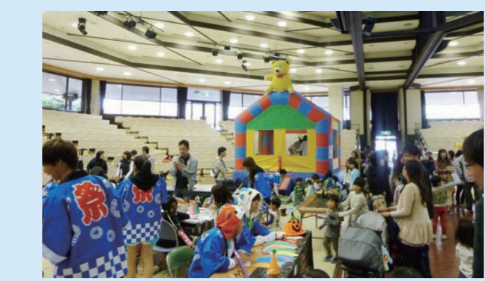
■ 同窓会提供ふわふわ

大学祭では、同窓会として子ども向けイベント「ふわふわ」を提供しております。ご来場の際は、たくさんの子どもの笑顔が元気に遊ぶ姿をぜひご覧ください。