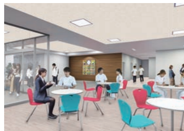
エントランスホール 明るく開放的なエントランスホール。授業の合間にグループ学習や談笑を行うなど、賑やかなコミュニケーションの場となります。