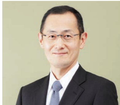
【山中 伸弥教授 プロフィール】

お問い合わせ 四天王寺大学 同窓会事務局(入試・広報課) TEL:072-956-3183(直通)