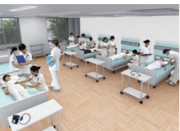
看護実習室 実習室1・2にはベッド20台、沐浴槽を設置。実習室3には一般病棟の4人部屋を想定した配置で、臨場感のある環境を整えています。