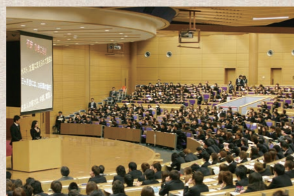
本学での仏教(礼拝)の授業風景