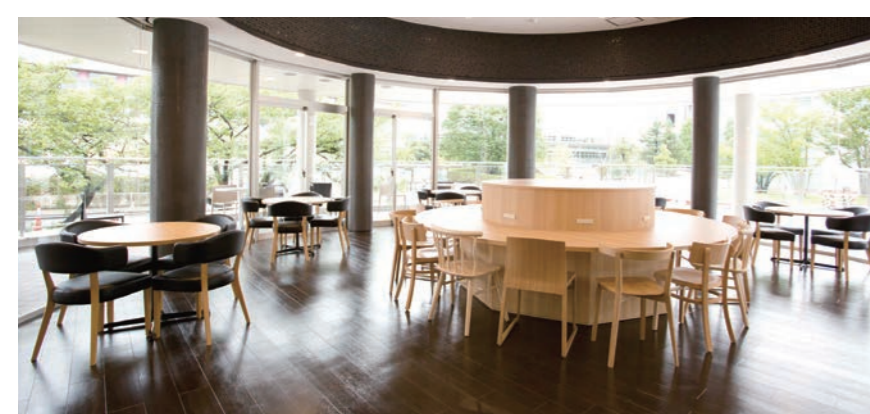
■ cococafe Cleanliness・Comfortable・Creation(清潔・快適で気持ちいい・創造的なカフェ)をコンセプトとしたカフェスペース。ドリンクや軽食など落ち着いた環境でリフレッシュできる空間となっています。

平成28年度夏学期からcococafeで「100円朝食」がスタートしました。学生の皆さんに生活習慣を見直し、朝食習慣の大切さを知ってもらい、勉学や課外活動にどんどんチャレンジする健康な学生生活を応援したいと考えています。 なお、「100円朝食」の実施には四天王寺大学同窓会のご支援を頂いています。