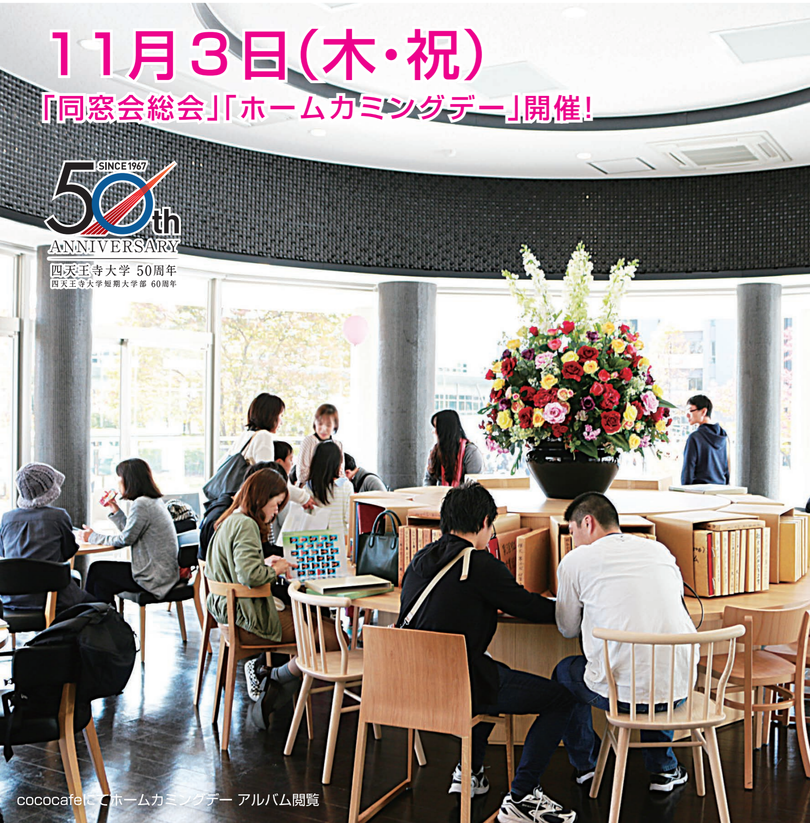
cococafeにてホームカミングデー アルバム閲覧