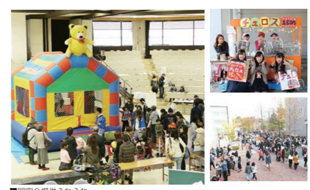
■ふわふわ