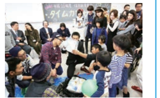
▲昨年の「保育科在学生・卒業生交流サロン」

本年も「保育科在学生・卒業生交流サロン」を開催します。学生時代の思い出話を花を咲かせたり、保育現場や子育てに関する情報を交換したり、在学生の疑問質問に答えていただけるスペースを準備してお待ちしています。保育科同窓生の皆様とお話し合わせの上、是非お立ち寄りください。懐かしい卒業生の皆様とお会いできるこの機会を、私たち教員も心から楽しみにしています。