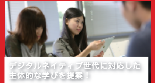
デジタルネイティブ世代に対応した 主体的な学びを提案!

予測困難な時代、答えのない問題に対して課題を見つけるチカラ、他者と協同で学びあうチカラが求められています。そのチカラを育成し、学生の主体的な学びを促進するために、ICT(情報通信技術)が注目されています。ICTは、人と人を結びコミュニケーション・ツールであり、能動的に使いこなすことで、プレゼンテーション実践のチカラも養うことができます。そこで四天王寺大学では、2013年に「ICTアクティブラーニング教室」と「ICT模擬授業教室」を新設し、電子黒板やiPad、クリッカーなどを整備しました。マルチメディアを活用した教材を使った授業や、リアルタイムで情報を共有する双方向授業、教室を飛び出したフィールドワーク型の授業など、ワクワクする授業やイベントを展開していきます。