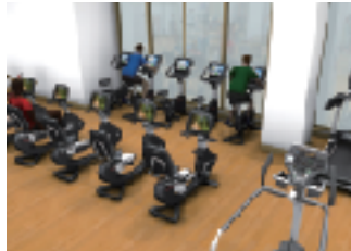
トレーニングルーム 卒業生の方々もご利用頂けます。

アリーナ、ダンススタジオ、屋内プールのほか、シャワールームやトレーニングルーム、カフェラウンジなどを備えた最新の体育館。平成27年6月の誕生に向け、建設を進めていきます。トレーニングルームは卒業生の方々もご利用頂けます。