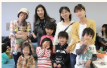
▲昨年の「保育科在学生・卒業生交流サロン」

本年も「保育科在学生・卒業生交流サロン」を開催します。学生時代の思い出話に花を咲かせたり、保育現場や子育てに関する情報を交換したり、在学生の疑問質問に答えていただけるスペースを準備して、お待ちしております。また、最近の保育科の活動について紹介する写真の掲示や、ビデオ上映も行います。 保育科同窓生の皆様!「保育科在学生・卒業生交流サロン」へ、お誘い合わせの上、お子様連れで是非お立ち寄りください。懐かしい卒業生の皆様とお会いできるこの機会を、私たち教員も心から楽しみにしています。