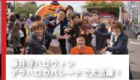
藤井寺ハロウィン デラハロのパレードで大活躍!

昨年秋、「あきない実践研究」を受講する1・2年生が、藤井寺駅周辺まちづくり協議会が主催するハロウィンイベント「商店街丸ごとデコレーション」(通称デラハロ)を手伝いました。地域の子どもたちが仮装して商店街をパレードする中、学生は子どもたちに風船を配ったり、安全に歩行できるように進路を確保したり、地域のリーダーやボランティアとともに大奮闘!「あきない実践研究」では、商店街等でのフィールドワークを行ないながら、地元の方々と交流し、まちの活性化と商業のあり方を考える、PBL型(企画を通じて課題解決に取り組む)の特色ある授業を展開しています。これからは地域と連携を図り、人材育成と産業振興、まちづくりに取り組んでいきます。