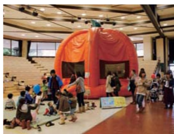
■ちびっ子広場「ふわふわ」